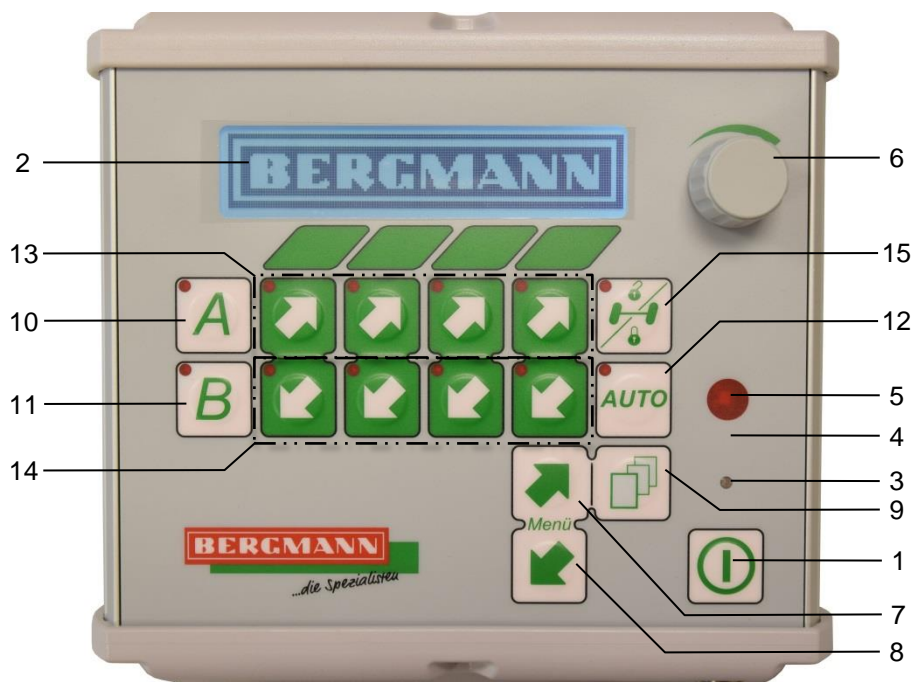
Afb. 1: Bedieningsinterface BCT20