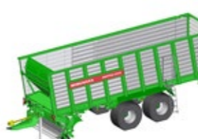
SHUTTLE 470 K