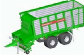
REPEX 320 K