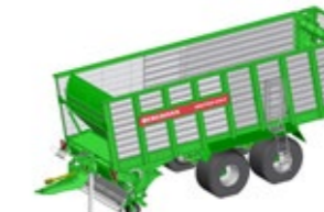
SHUTTLE 410 S