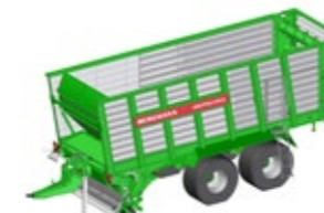
SHUTTLE 370 S