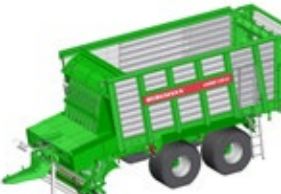
CAREX 330 S