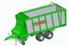
ROYAL 300 K