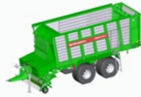
REPEX 300 S