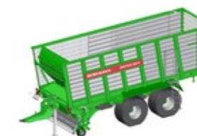
SHUTTLE 390 K