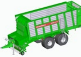
REPEX 340 S