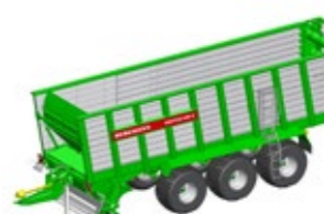
SHUTTLE 490 S