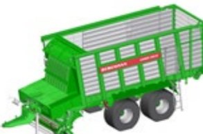
CAREX 350 K