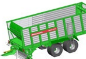
CAREX 410 S