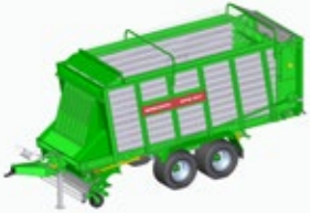
ROYAL 280 S