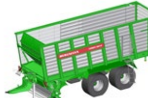
CAREX 390 K