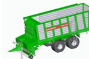
REPEX 360 K