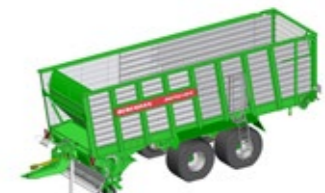
SHUTTLE 430 K