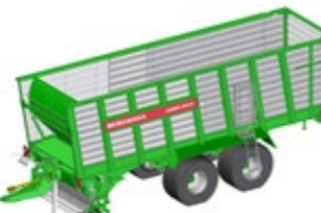
CAREX 430 K