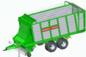
ROYAL 280 K