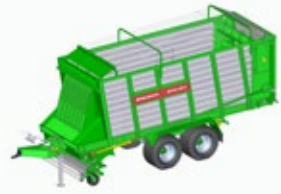
ROYAL 260 S