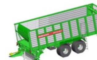
SHUTTLE 450 S