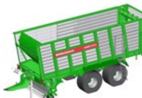
CAREX 370 S