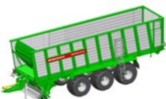
SHUTTLE 510 K